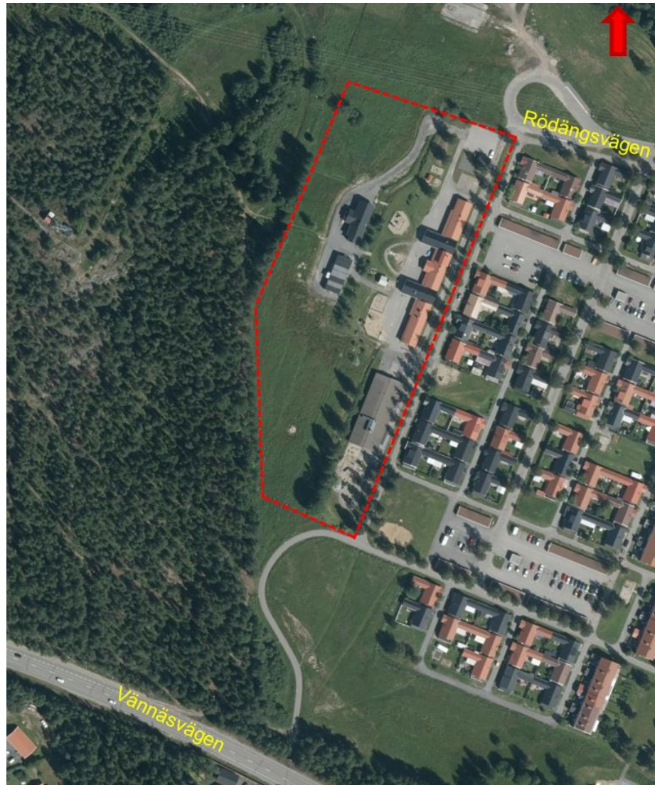
Figur 1: Rödmarkering motsvarar ungefärligt läge för utförd geoteknisk undersökning (Källa: Lantmäteriet, 2018).

På WSP Samhällsbyggnad har på uppdrag av Umeå kommun, utfört översiktliga geotekniska undersökningar inför detaljplanering av fastigheter Gitarren 1 och 2 samt del av Backen 4:25 i området Rödäng, Umeå, se figur 1 .