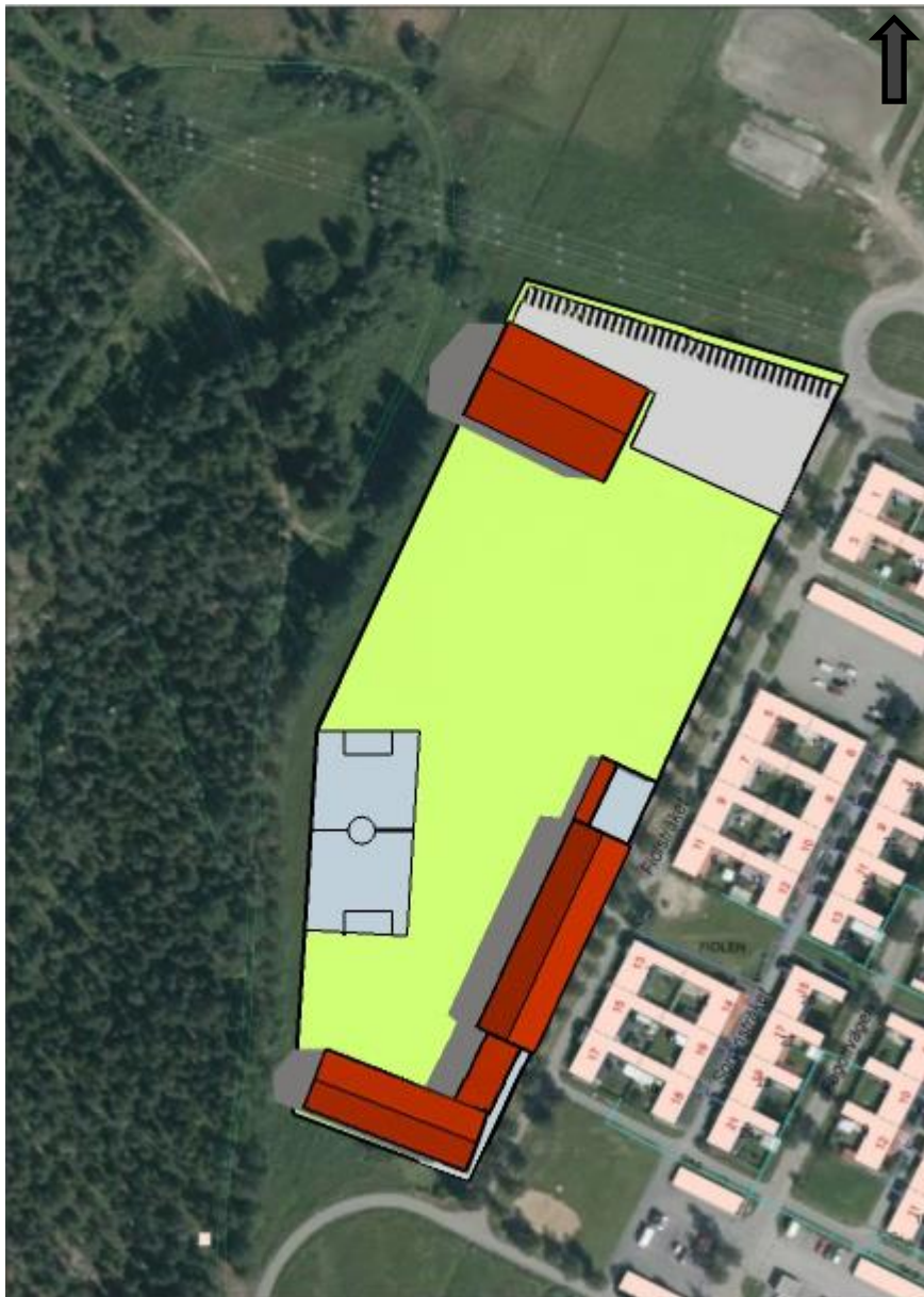
Figur 2: Situationsplan över området.